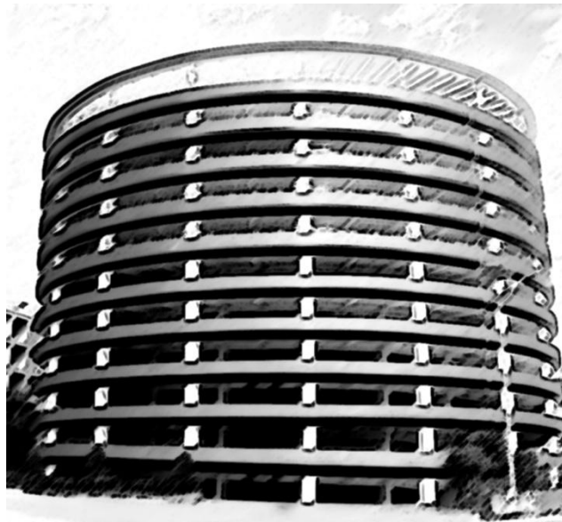
图E.1 自行式立体充电站